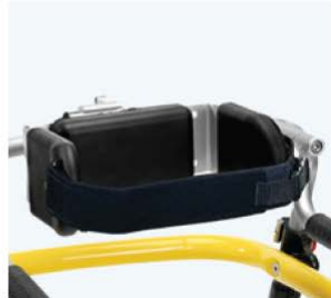
侧面支撑束带 Sn4016 行走时提供额外安全 规格 尺寸 统一 L:38-47 cm