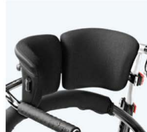
后背支撑, 可调 86886 仅限规格 3。安装在十字 支杆上。 统一 W:24-29 cm x H:18 cm