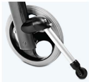
防倾覆, 摆动式 额外安全, 预防助行器倾 覆 86815 规格 1-2 86815-35 规格 3