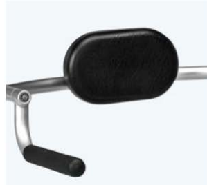
后背支撑 86816 稳定骨盆 规格 尺寸 统一 H:11 x W:18 cm