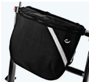
口袋 86843 装运玩具等 限重 5 公斤, 规格 3 统一规格