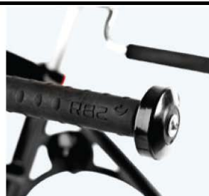
球形把手 86861 统一规格