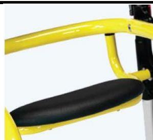
下翻座位 8682x 在孩子疲劳时为孩子提供一个休 息的位置。 规格 尺寸 1-2 W:30 x D:12 cm - 距离地板的高度: 29/42 厘米 3 W:36 x D:16 cm - 距离地板的高度: 56 厘米