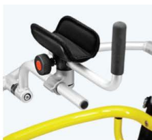
带手柄前臂支撑 8681x 固定儿童手臂位置 规格 尺寸 1 衬垫: L 15xW 8 cm 2 衬垫: L 18xW 10 cm 3 衬垫: L 18xW 10 cm