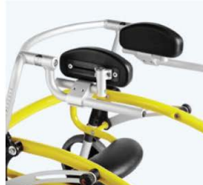
腕部支撑 86819 为孩子提供侧面支撑 规格 尺寸 统一 H:8 x W:19 cm