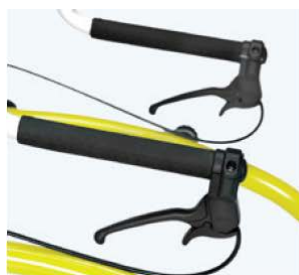
手刹 868xx 购物/停车等有效刹车 86834 规格 1-2 86873 规格 3