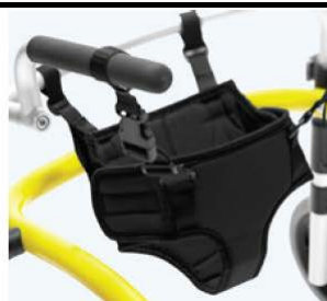
悬挂座位 8682x 规格 1+2 提供部分重量支撑 规格 尺寸 1 腰部: 60 cm 2 腰部: 70 cm