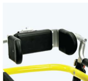
后背和侧面支撑, 短吻 鳄 8680x 提供侧面腕部支撑 小型 H 9xW 17 厘米 大型 H10xW 24 厘米