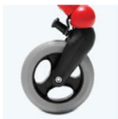
带方向稳定器前轮