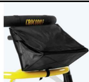
口袋 86839 装运玩具等 限重 3 公斤 规格 1+2